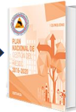
Plan 2016 – 2020 II Quinquenio