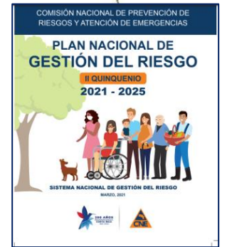
Plan 2021 – 2025 II Quinquenio