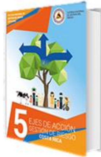
Política 2016 - 2030