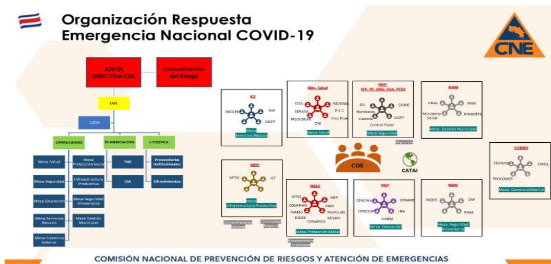
Imagen 2 Mesas operativas de trabajo Covid-19